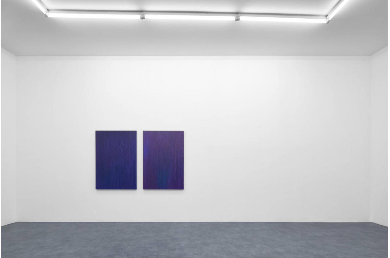
Hermann Bergamelli, Valgua, A+B Gallery, 2023, exhibition view