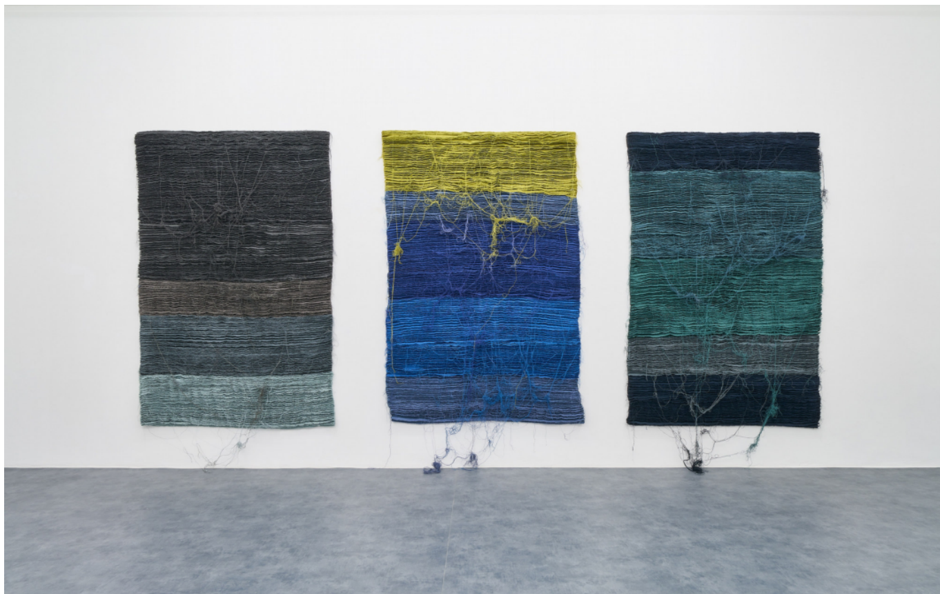
Electro Glide in Blue Hermann Bergamelli A+B Gallery solo show, 2020