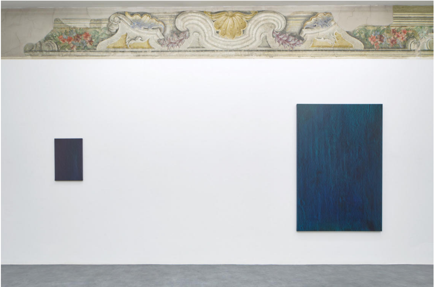
Hermann Bergamelli, Valgua, A+B Gallery, 2023, exhibition view