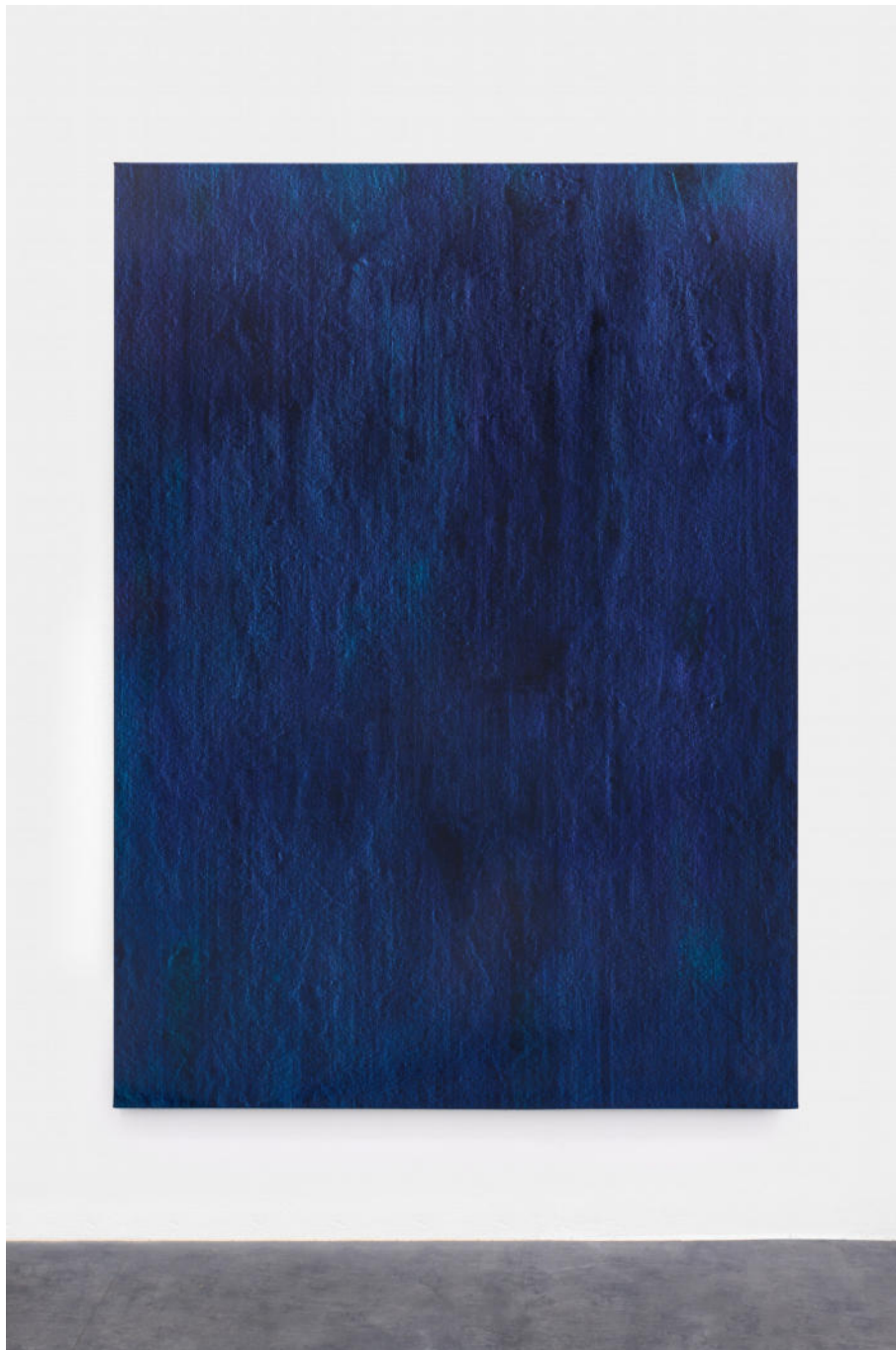
Hermann Bergamelli, Tempo al tempo, 2022 oil-based color impasto worked on canvas, 180x130 cm, Euro 6500 VAT incl.