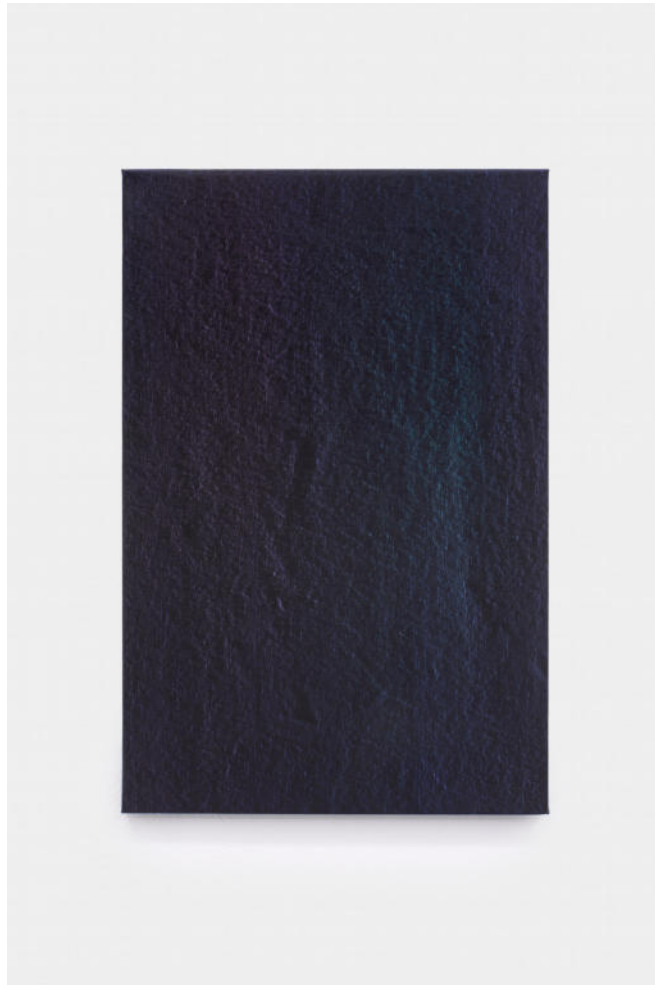
Hermann Bergamelli, Ventosa, 2023 oil-based color impasto worked on canvas, 60x40 cm Euro 2500 VAT incl.