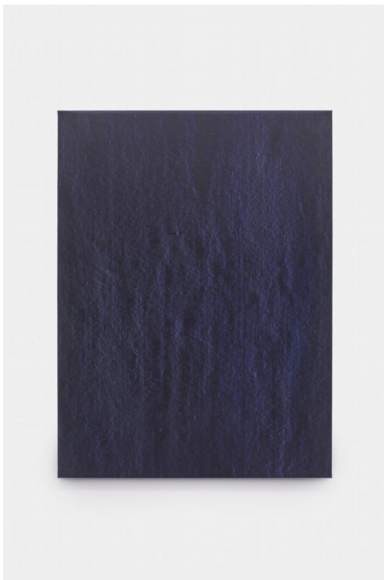
Hermann Bergamelli, Vento solare, 2022 oil-based color impasto worked on canvas, 80x60 cm Euro 3200 VAT incl.