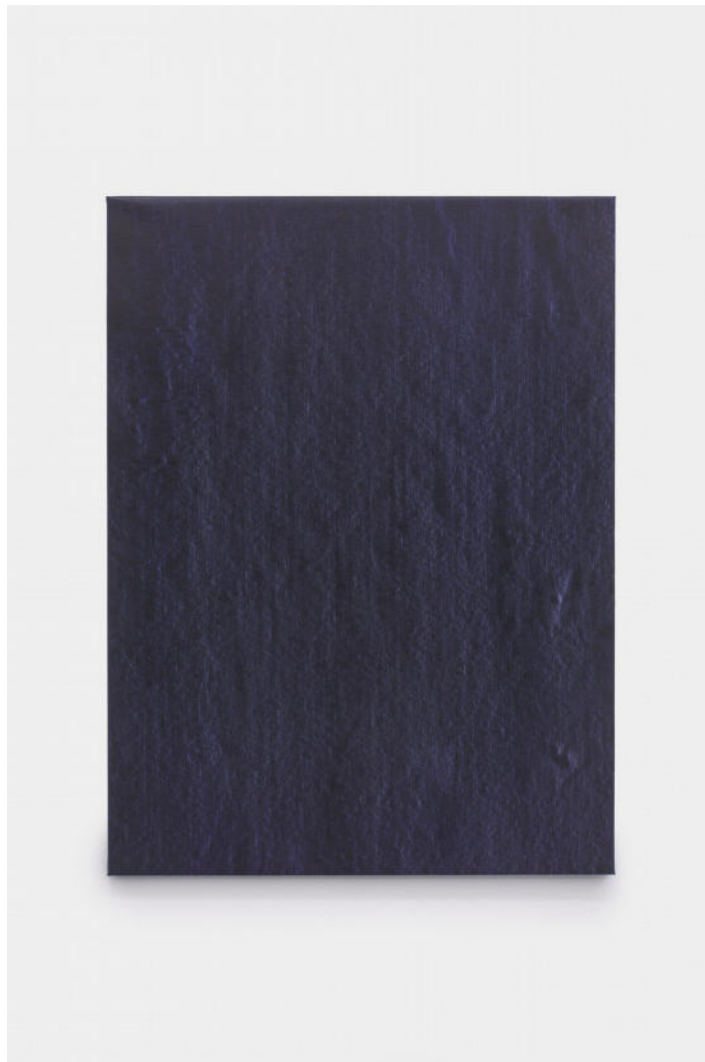
Hermann Bergamelli, Luna storta, 2022 oil-based color impasto worked on canvas, 80x60 cm, Euro 3200 VAT incl.