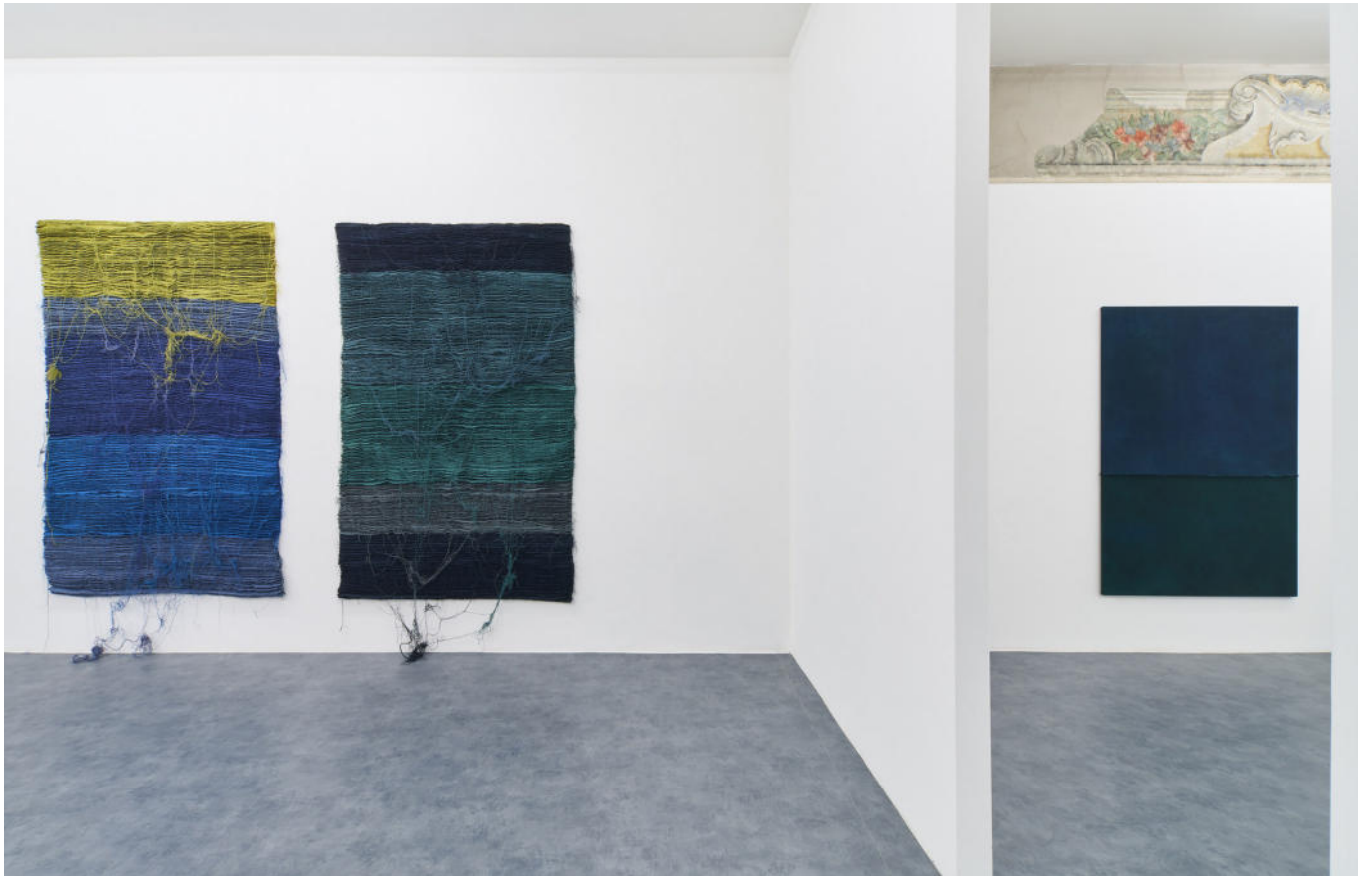
Electro Glide in Blue Hermann Bergamelli A+B Gallery solo show, 2020