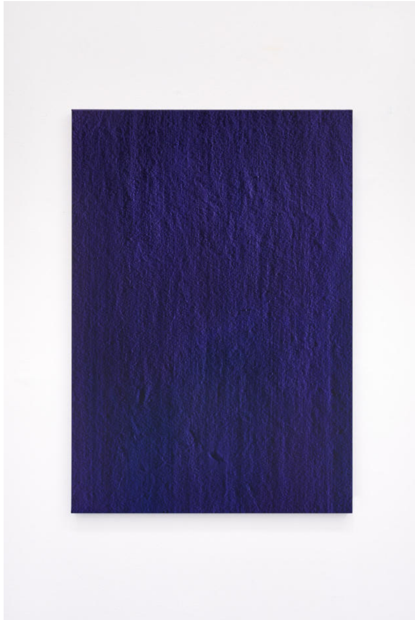
Hermann Bergamelli, I maghi, 2023 oil-based color impasto worked on canvas, 130x90 cm, Euro 4500 VAT incl.