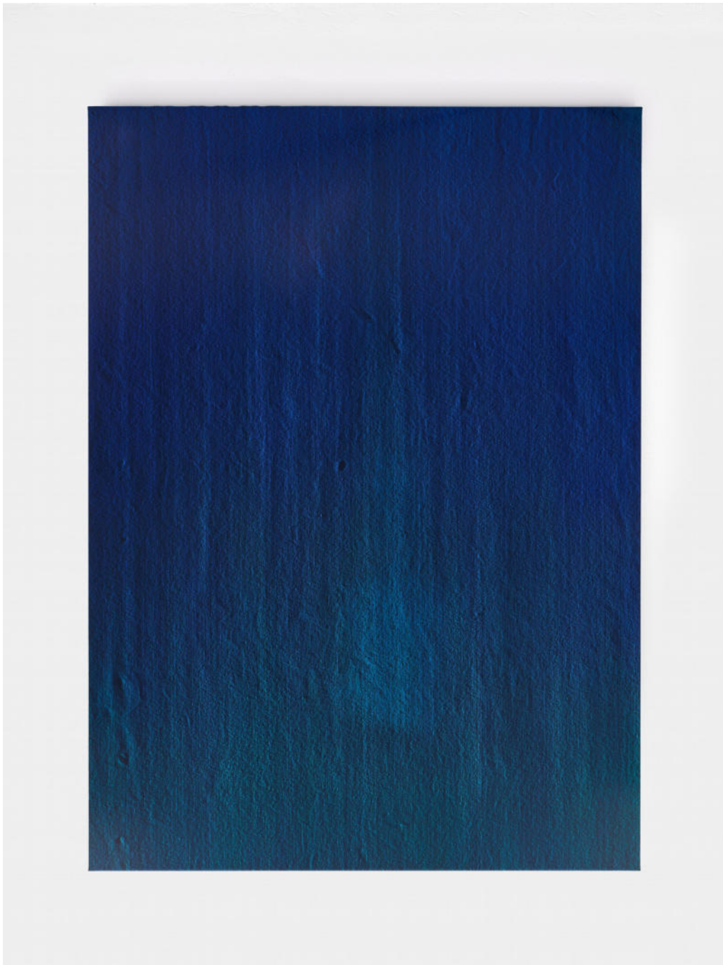
Hermann Bergamelli, Lentasia, 2023 oil-based color impasto worked on canvas, 180x130 cm, Euro 6500 VAT incl.