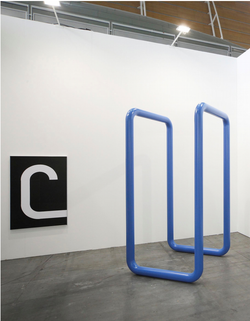
Tobias Hoffknecht Installation view Artissima, 2019 stand A+B Gallery