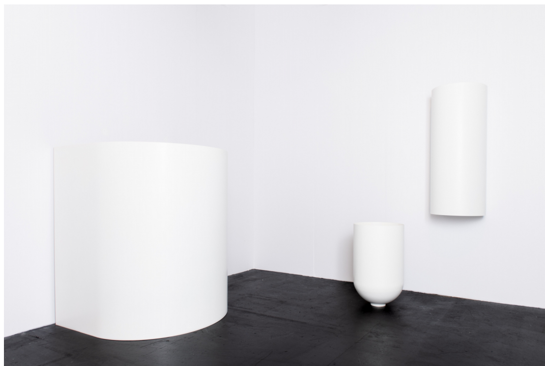
Tobias Hoffknecht Installation view Art Cologne, 2019 stand Galerie Crone