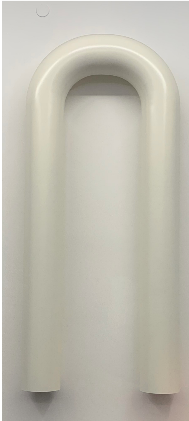
Tobias Hoffknecht, 196, steel and laquer ral 9010, 220x88x22cm, 2019