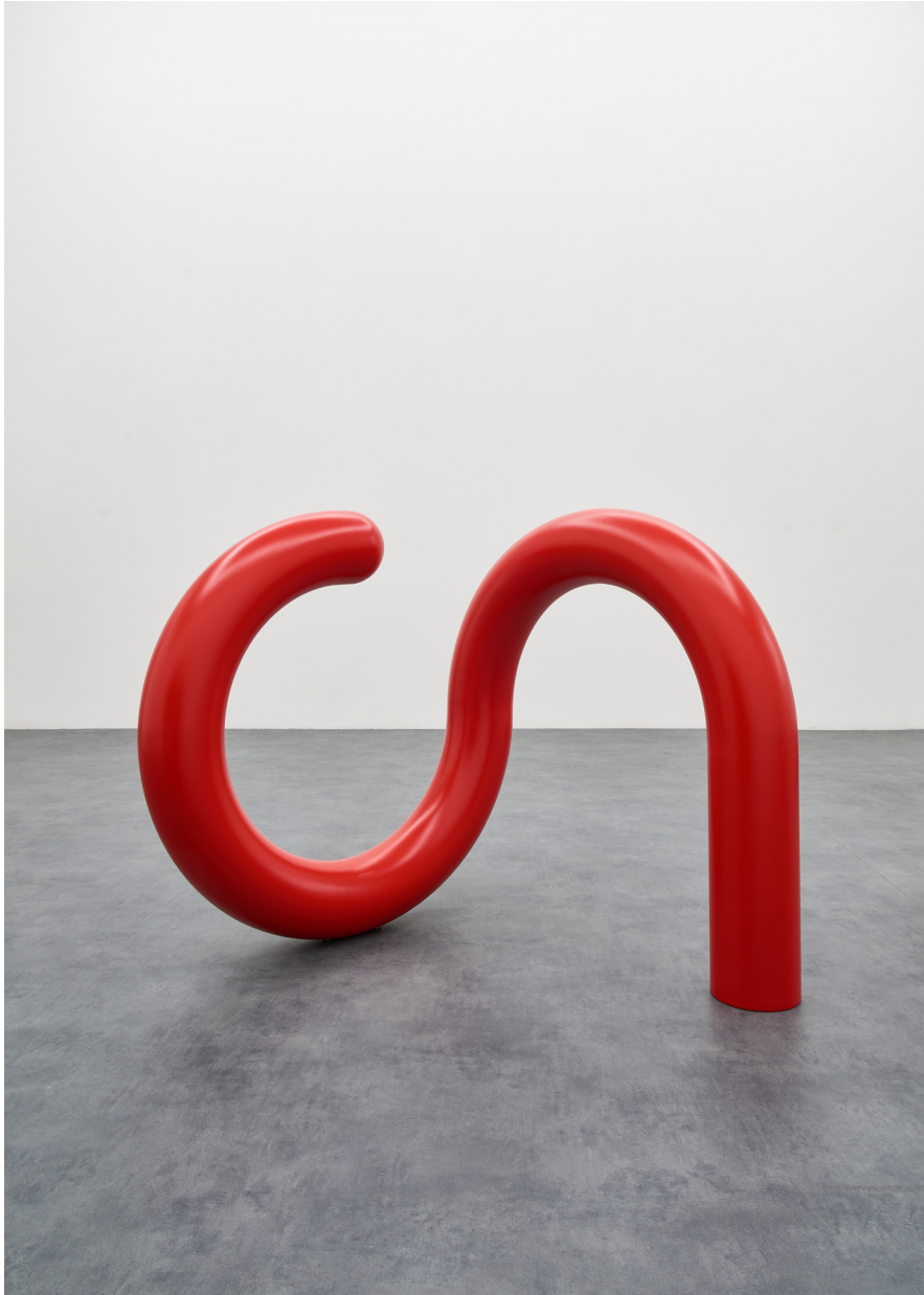
Tobias Hoffknecht, Power of parody, steel and varnish ral 3020, 84x84x84 cm, 2021