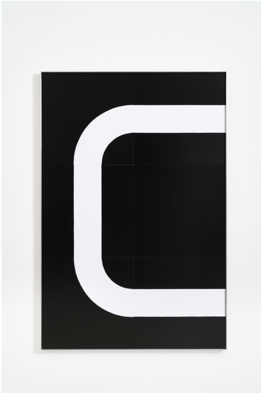
Tobias Hoffknecht, Untitled, 2019, screen printing on paper, 120x80 cm