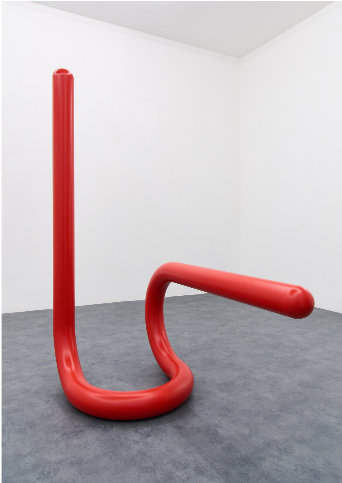
Tobias Hoffknecht, Excitement, steel and varnish ral 3020, 209x84x149 cm, 2021