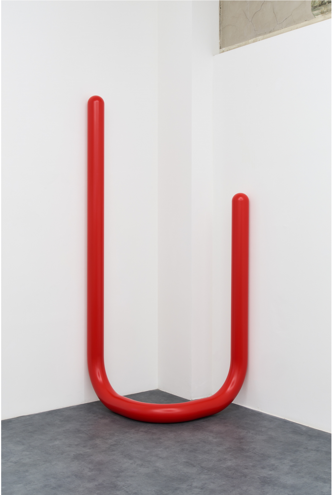
Tobias Hoffknecht, Ambush, steel and varnish ral 3020, 247x84x84 cm, 2021