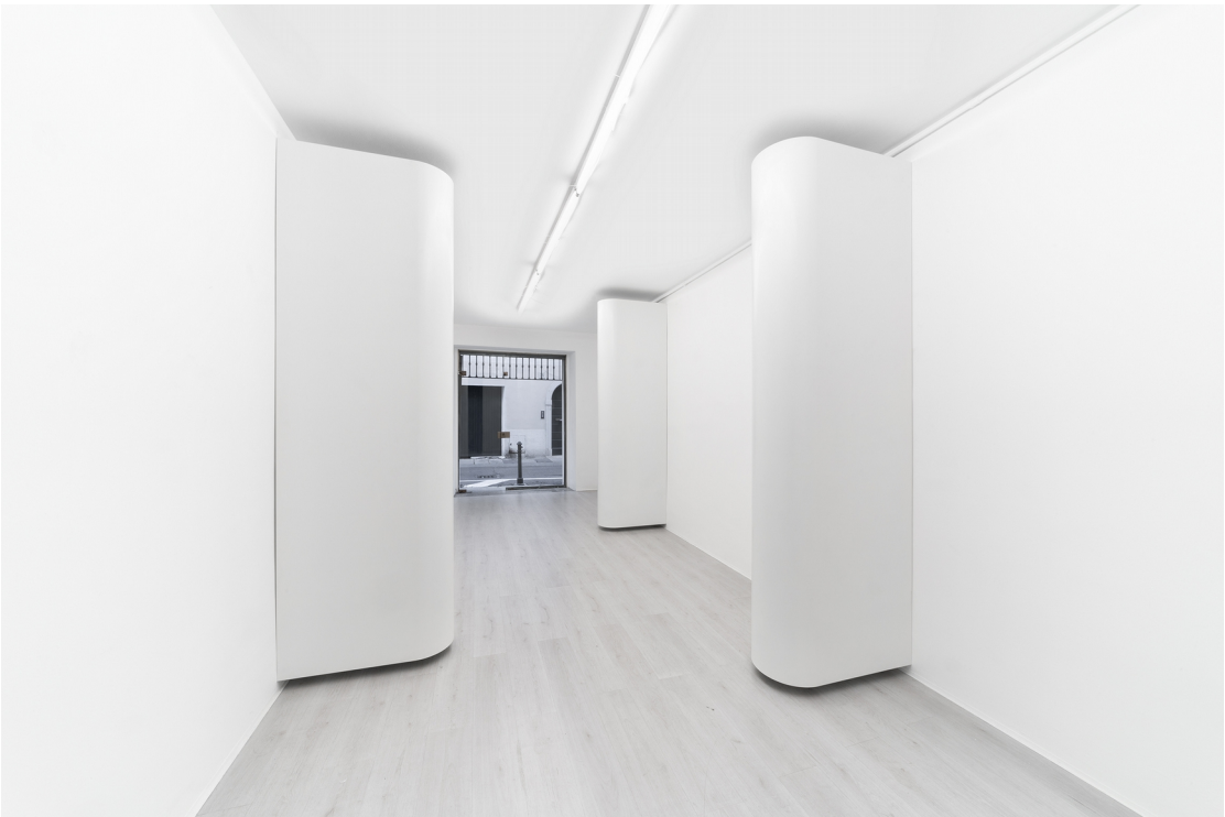
Tobias Hoffknecht Limited attention, 2018 A+B Gallery