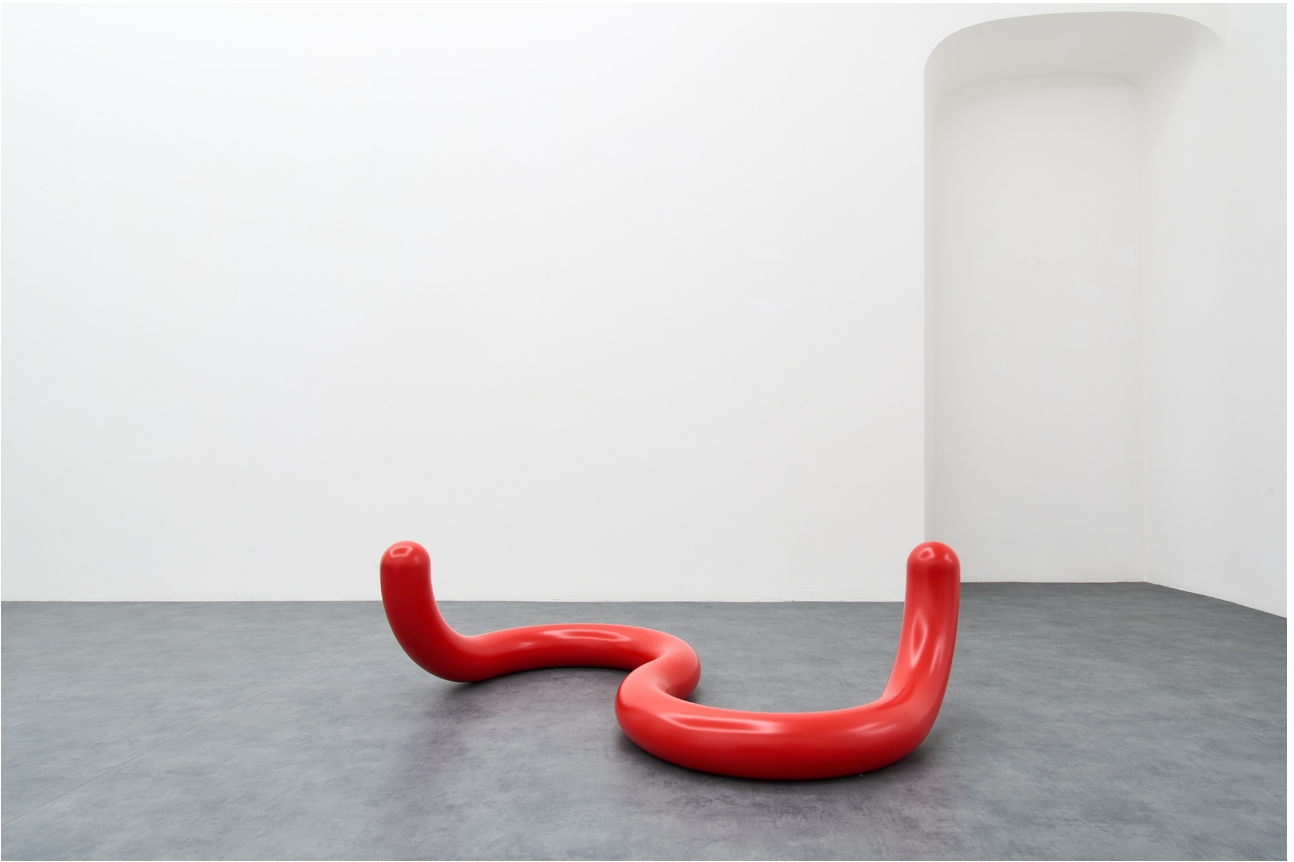
Tobias Hoffknecht, Ride red, steel and varnish ral 3020, 49x168x84, 2021