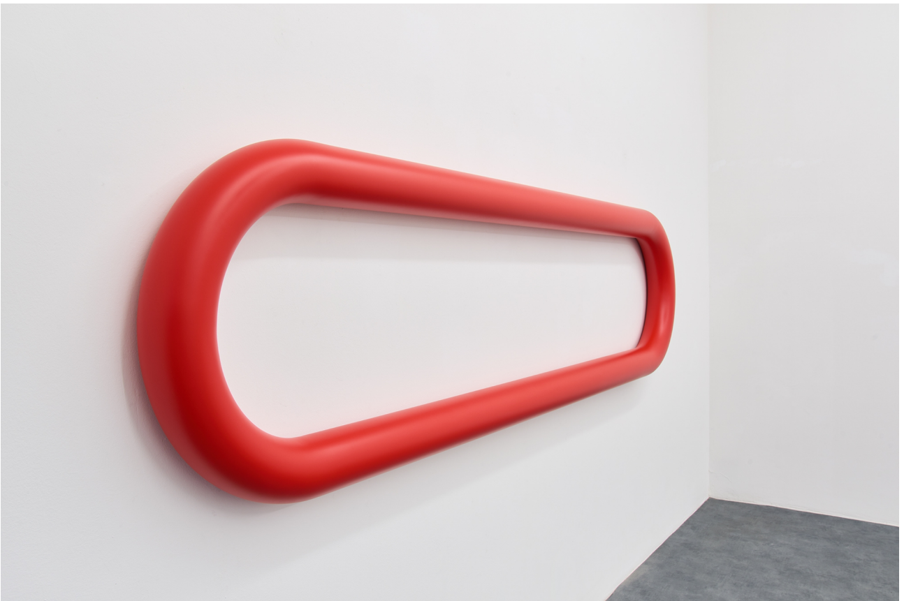
Tobias Hoffknecht, Little Mishap, steel and varnish ral 3020, 84x300x14, 2021