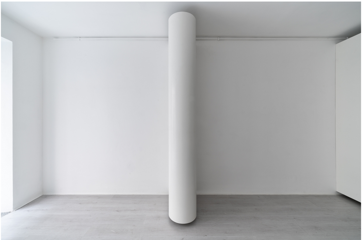
Tobias Hoffknecht Limited attention, 2018 A+B Gallery