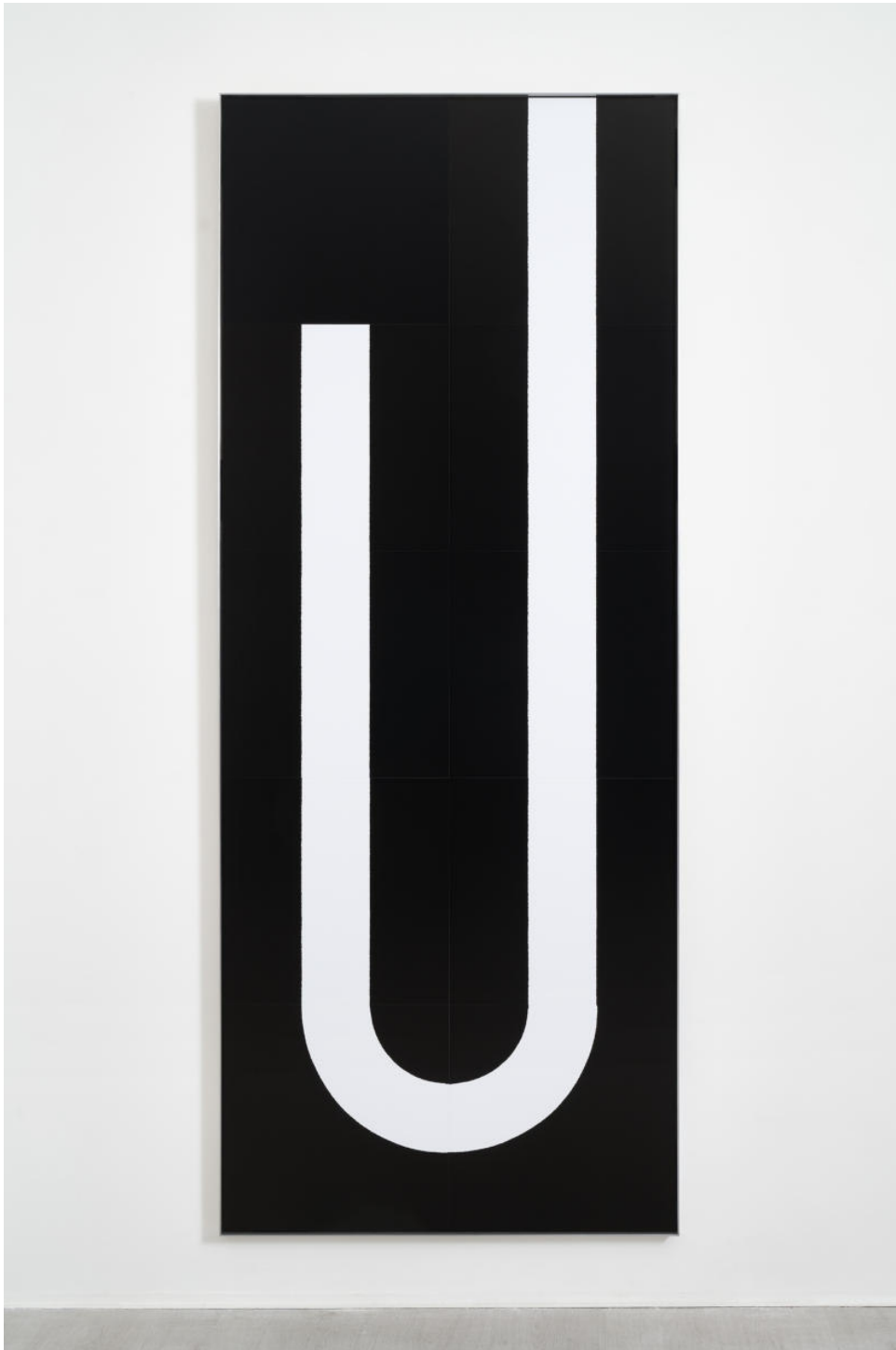
Tobias Hoffknecht, Untitled, 2019, screen printing on paper, 180x80 cm